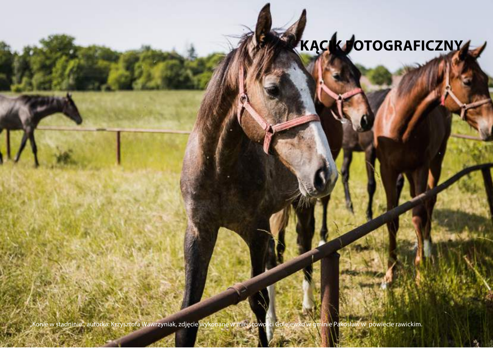
„Konie w stadninie”, autorka: Krzysztofa Wawrzyniak, zdjęcie wykonane w miejscowości Golejewko w gminie Pakosław w powiecie rawickim.