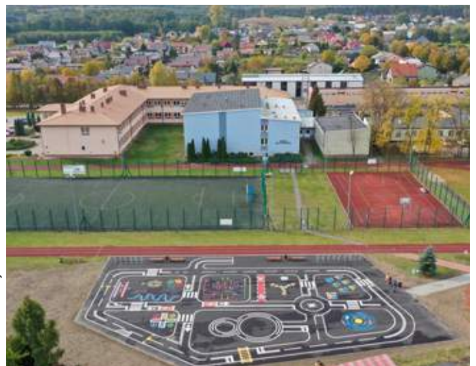
Miasteczko ruchu drogowego we Władysławowie, w powiecie tureckim

sprawą funkcjonujących w całej Europie lokalnych grup działania, dystrybuuje fundusze unijne, zaspokajając zgłaszane przez społeczności lokalne potrzeby. Wśród namacalnych efektów wdrażania inicjatywy LEADER w województwie wielkopolskim, warto wspomnieć przede wszystkim o setkach, jeśli nie tysiącach urządzonych placach zabaw i siłowni zewnętrznych, boisk wielofunkcyjnych, skwerów, czy skateparków. LEADER to jednak w dużej mierze wsparcie przedsiębiorczości. Środki w ramach PROW 2014-2020 kierowane były na wsparcie nowopowstających firm, ale również na rozwój już istniejących. Zakres branż, w których mieszkańcy naszego województwa postanowili ulokować pozyskany kapitał jest bardzo szeroki: od branży budowlanej, poprzez zakłady wulkanizacyjne, przetwórstwo, działalność edukacyjną, medyczną, weterynaryjną, po usługi artystyczne. Z pomocy finansowej skorzystało blisko 1600 firm w Wielkopolsce.