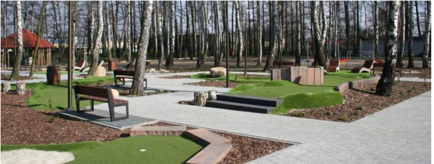
Pole do minigolfa przy kompleksie sportowo-rekreacyjnym Kąpielova w Ostrzeszowie.

Wiejskich na lata 2007-2013 oraz Programu Rozwoju Obszarów Wiejskich na lata 2014-2020. Łącznie na wsparcie zadań z zakresu gospodarki wodno-ściekowej w województwie wielkopolskim przeznaczono bowiem kwotę blisko 870 milionów złotych. Pozwoliła ona na wybudowanie lub przebudowanie 1840 km wspomnianych sieci kanalizacyjnych, to mniej więcej tyle, ile liczy droga z Poznania do Rzymu. Warto do tego dodać ponad 900 kilometrów nowej lub zmodernizowanej sieci wodociągowej, wtedy uzyskujemy odcinek dłuższy niż odległość Madrytu od Poznania.