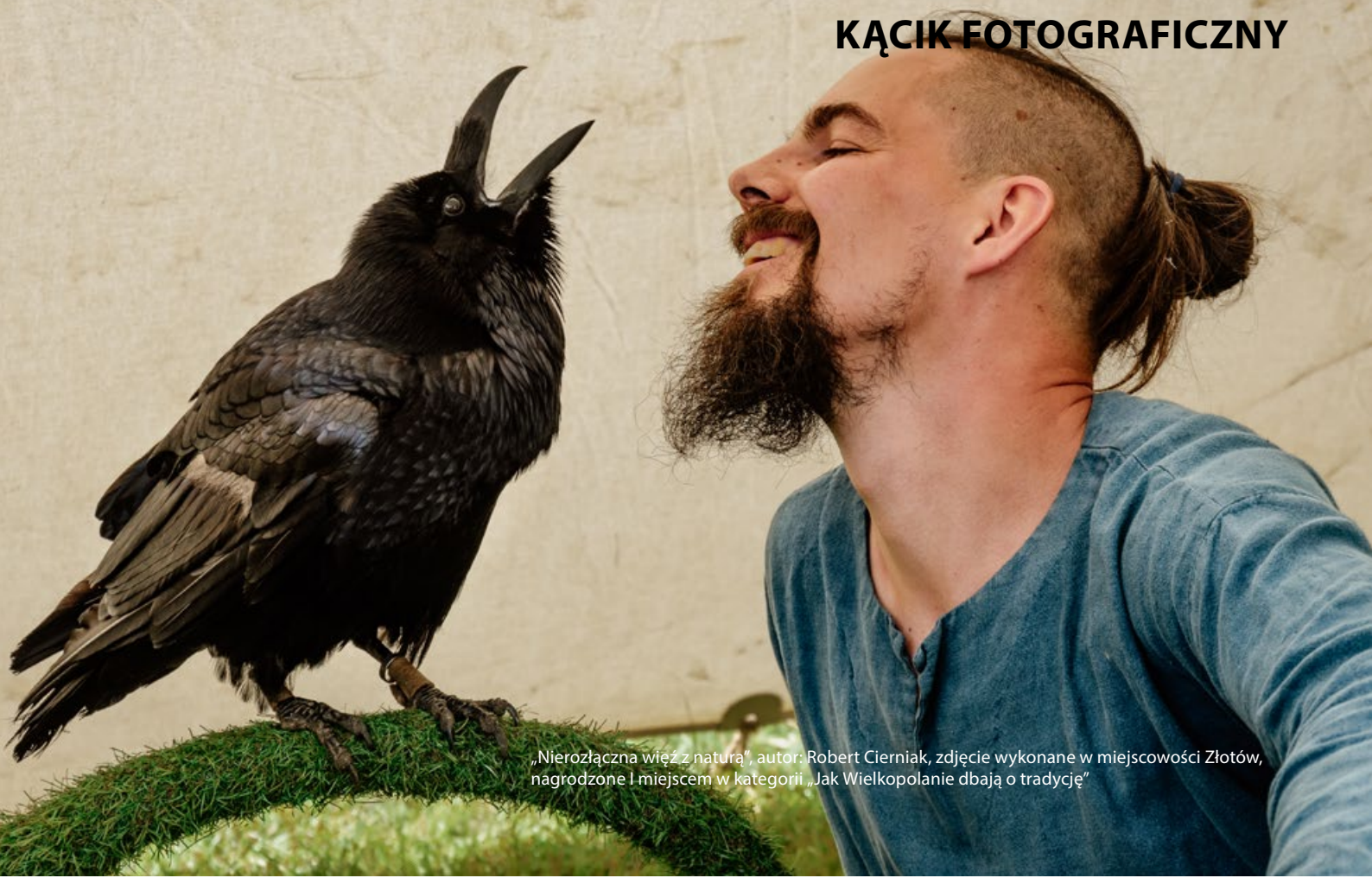
„Nierozłączna więź z naturą”, autor: Robert Cierniak, zdjęcie wykonane w miejscowości Złotów, nagrodzone I miejscem w kategorii „Jak Wielkopoleanie dbają o tradycję”