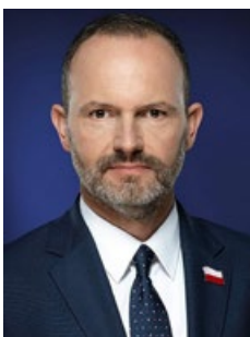
Krzysztof Hetman Poseł do Parlamentu Europejskiego od 2014 roku

Na łamach biuletynu publikujemy wypowiedzi osób, które brały aktywny udział we wdrażaniu PROW 2007-2013 oraz 2014-2020 na poziomie całej Unii Europejskiej, ale szczególnie prezentujemy doświadczenia i refleksje płynące z ich działalności na rzecz wielkopolskiej wsi.