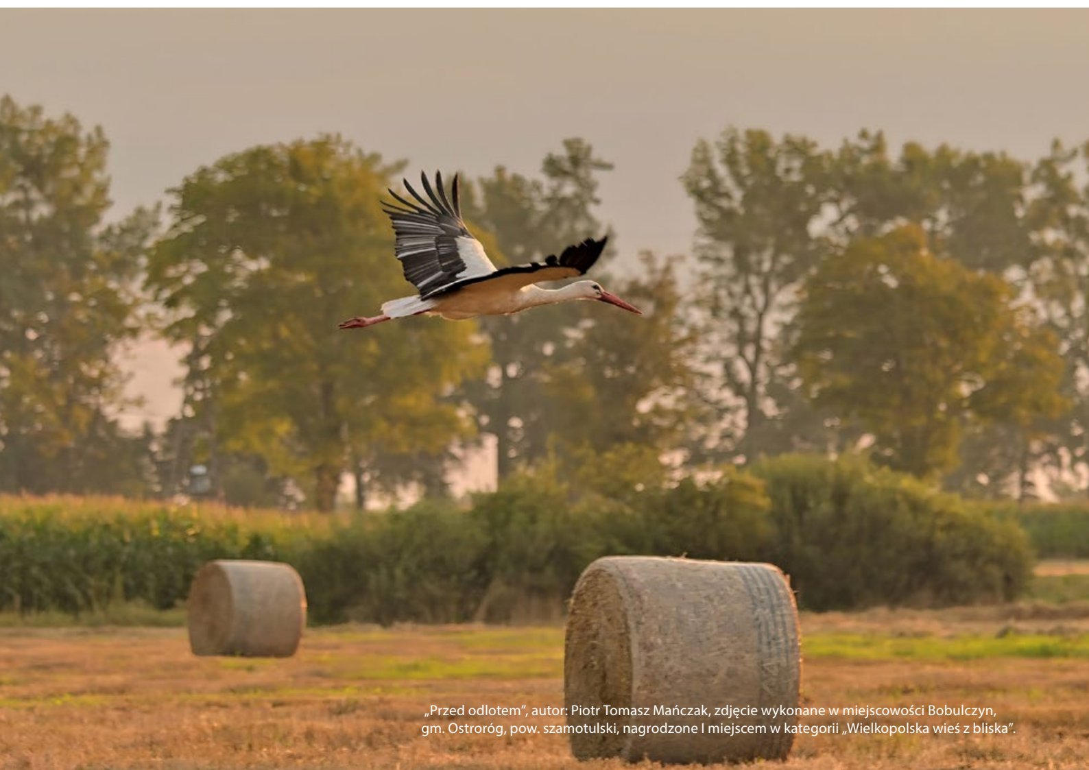
„Przed odlotem”, autor: Piotr Tomasz Mańczak, zdjęcie wykonane w miejscowości Bobulczyn, gm. Ostroróg, pow. szamotulski, nagrodzone I miejscem w kategorii „Wielkopolska wieś z bliska”.