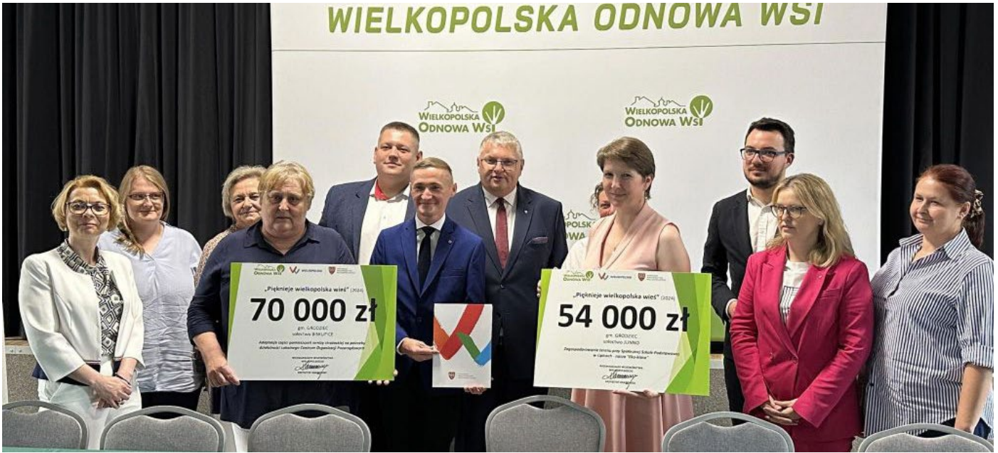
Sołectwa Junno i Biskupice w gminie Grodziec w powiecie konińskim pozyskały fundusze na łączną kwotę 124 000 zł.

Na realizację regionalnej odnowy wsi Samorząd Województwa Wielkopolskiego przeznaczył dotąd ok. 60 milionów złotych, co umożliwiło realizację ponad 2 500 projektów w całym regionie. Do tej kwoty trzeba doliczyć środki zakontraktowane na ten rok w ramach konkursu „Pięknieje Wielkopolska Wieś”, czyli aż 11,3 miliona złotych. Na koniec maja 2024 r. Sejmik Województwa Wielkopolskiego podjął decyzję o wyborze projektów do dofinansowania w ramach XIV już edycji tego ważnego przedsięwzięcia. Fundusze przyznane zostały 192