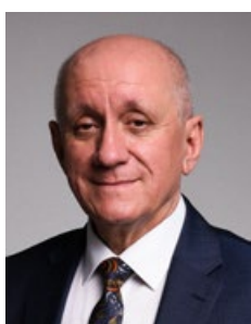
Paweł Rajski Starosta Ostrowski

Przed nami ostatni budżet UE, z którego Polska może pozyskać znaczące fundusze. Musimy nadal wzmacniać nasze rolnictwo, by mogło skutecznie konkurować w dynamicznie zmieniającym się świecie.