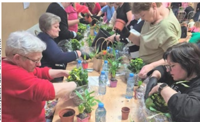
Warsztaty wielkanocne w Chełście w gminie Drawsko.

Efektowny i efektywny przebieg miały również warsztaty w Wojciechowie zorganizowane przez KGW „Wojciechowianki”. Uczestnicy wyplatali palmy wielkanocne, zdobili świece techniką decoupage oraz przygotowali ozdobę w postaci kurki wielkanocnej. Podczas warsztatów pracownicy Turkowskiej Unii Rozwoju T.U.R. prowadzili punkt informacyjny poświęcony prowadzonym naborom wniosków oraz szerokiemu spektrum działań podejmowanych między innymi w zakresie ekologii. Uczestnicy wszystkich spotkań mogli skorzystać z poczęstunku zapewnionego przez KGW w postaci słodkich wypieków.