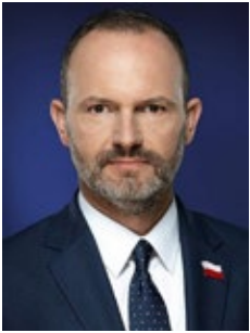
Krzysztof Hetman Posel do Parlamentu Europejskiego

W lipcu 2025 roku Komisja Europejska przedstawiła projekt Wieloletnich Ram Finansowych na lata 2028-2034. Polska w nowym budżecie otrzyma największą pulę środków do dyspozycji ze wszystkich państw członkowskich. W nowej perspektywie finansowej możemy spodziewać się z jednej strony centralizacji funduszy, ale również uelastycznienia procedur. Obecna sytuacja międzynarodowa jest powodem, dla którego coraz większą uwagę zaczęto zwracać na tzw. zasadę „dual use”. Oznacza ona w skrócie takie projektowanie infrastruktury, aby mogła być efektywnie wykorzystana dla podniesienia obronności krajów Wspólnoty. Stworzenie jednego, wspólnego źródła wydatków umożliwiającego realizację szerokiego spektrum zadań w miejsce bardzo wielu dotychczasowych Funduszy Europejskich ma zapewnić większą synergię i ułatwić koordynację działań ukierunkowanych na rozwój miast i wsi. Wymaga jednak szeroko zakrojonych dyskusji z udziałem wszystkich zainteresowanych stron. Jesteśmy w trakcie debaty poświęconej temu tematowi, dlatego cieszę się, że przedstawiciele samorządów lokalnych województwa wielkopolskiego aktywnie się w nią włączają i formułują konkretne postulaty i oczekiwania.