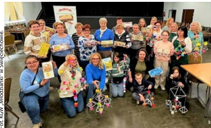
Fot. KGW „Młodzianki” w Świąciechowie.

Warsztaty w Wojciechowie w gm. Kawęczyn.