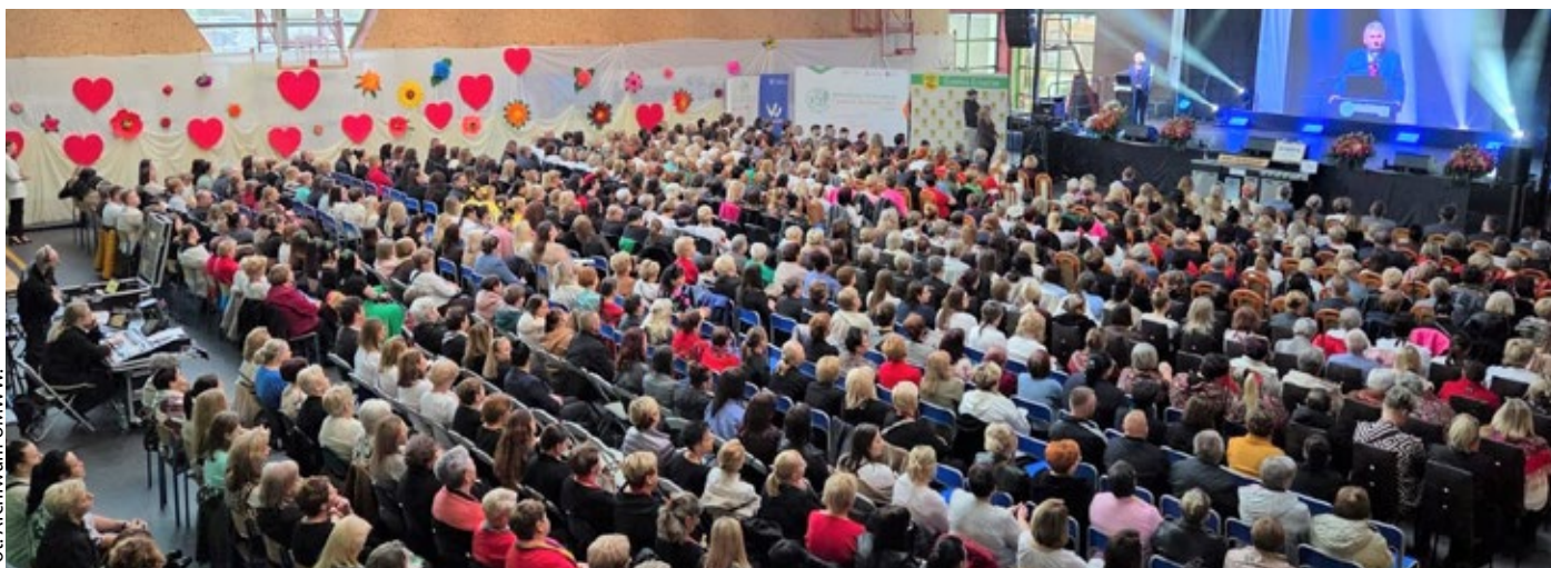
II Wielkopolskie Samorządowe Forum Kół Gospodyń Wiejskich w Liskowie zakończyło cykl spotkań informacyjnych z udziałem KGW w każdym powiecie naszego regionu. Spotkanie odbyło się 16 marca 2026 r. i zgromadziło blisko 600 uczestniczek i uczestników.